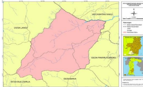
Gambar 1 Peta Administrasi Kelurahan Kahu

peluang untuk dijadikan sebagai responden. Data primer terdiri atas identitas responden, kondisi usahatani kemiri, tanaman selain kemiri, pemanfaatan tanaman kemiri, harga penjualan kemiri, pendapatan selain kemiri, serta biaya-biaya yang dikeluarkan (meliputi upah pekerja dan harga alat) selama pengelolaan kemiri. Data yang dikumpulkan untuk menghitung pendapatan yakni data selama setahun (2019)